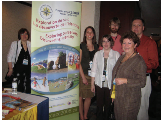
Congrès de l'ACC à Vancouver, mai 07

Représentants étudiants du Nouveau-Brunswick